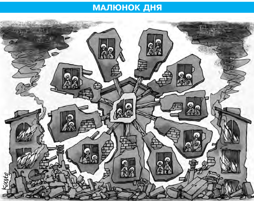
Млин з невинними душами. Країна-терорист рф продовжує воювати з українськими житловими будинками.