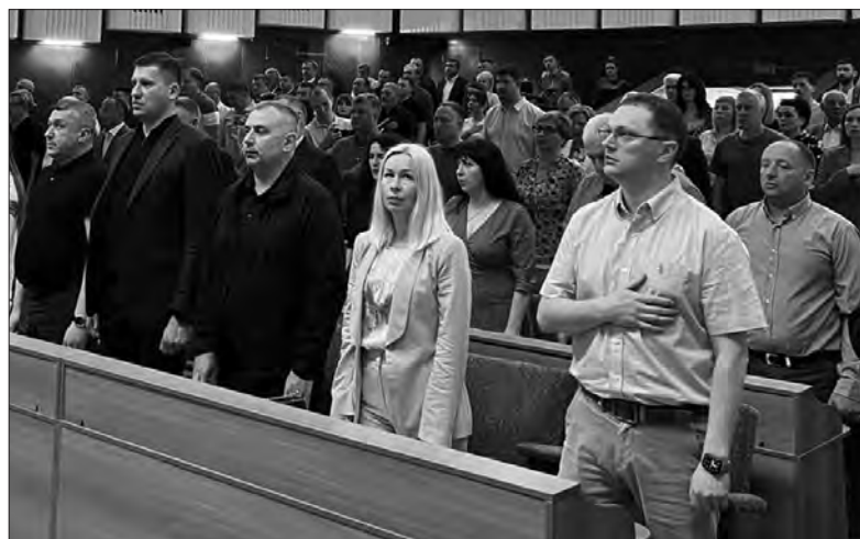
Серед запрошених — народна депутатка Олена Вінтоняк (друга праворуч у першому ряду).

Після затвердження основного фінансового документа області за перший квартал в залі засідань жваво обговорили й інші важливі питання. Значну частину вільних залишків із надходжень (280 мільйонів гривень) спрямували на підтримку мобілізаційної підготовки та оборонної робо-